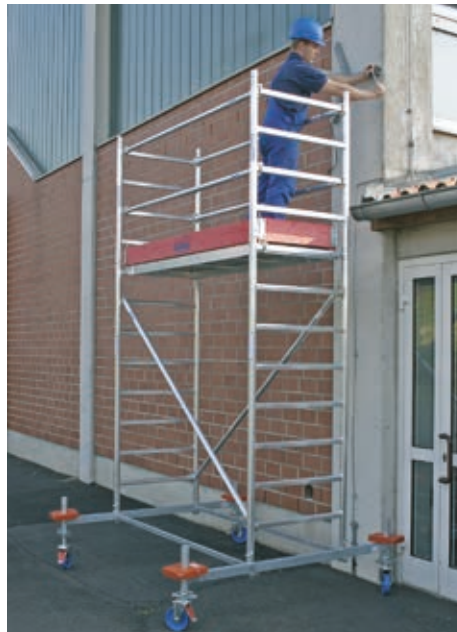
Длина помоста: 2,00 м – Ширина помоста: 0,75 м