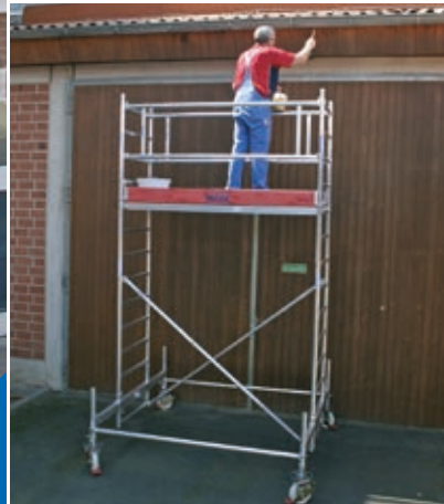
Длина помоста: 2,00 м – Ширина помоста: 0,75 м