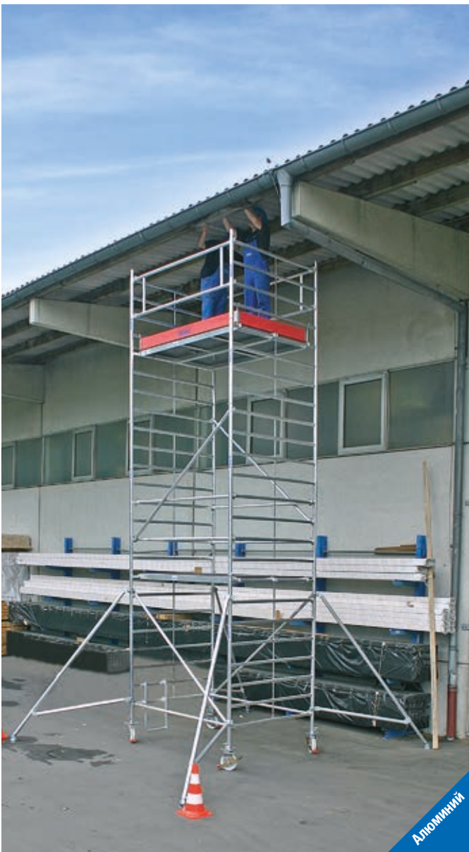
Длина помоста: 2,00 м – Ширина помоста: 1,50 м

i В зависимости от варианта конструкции должны использоваться балластные грузы (Аксессуар). Информацию о балласте можно найти в Инструкции по использованию или на нашем сайте. Аксессуары можно найти на стр. 172.